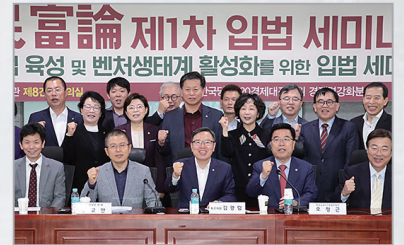
민부론 제 1차 입법 세미나 주최