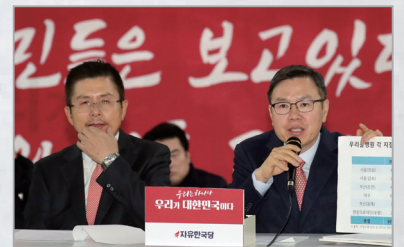
친문농단 게이트 현안 보고