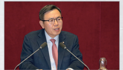
필리버스터 4시간 12분 발언 중