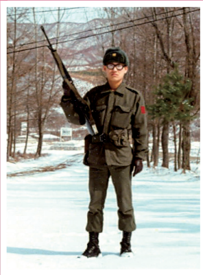
• 1979년 육군3사단 백골부대 시절 •