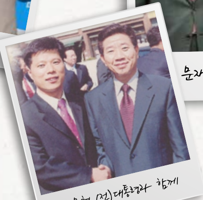
유혜원 (전) 대통령과 함께