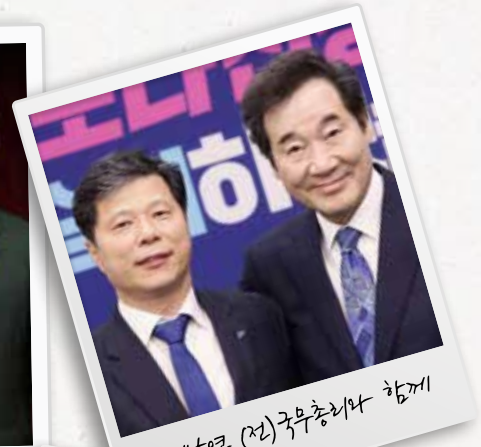
이낙연 (전) 국무총리와 함께