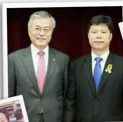
문재인 대통령과 함께