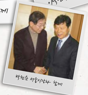
박원순 서울시장과 함께