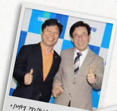
이재명 경기도지사과 함께