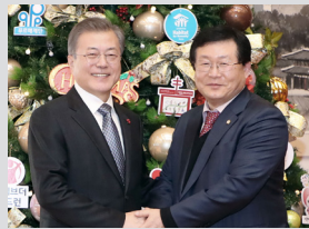
청와대 문재인대통령과 함께