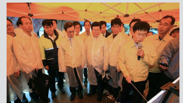
강원도 태풍피해현장 방문