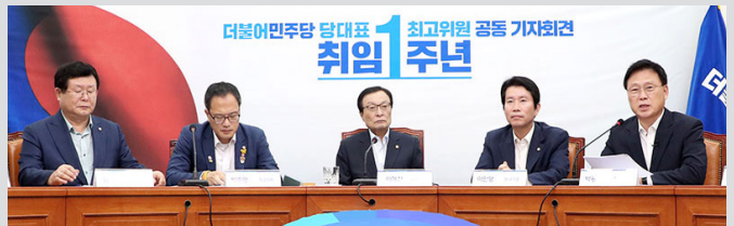
더불어민주당 당대표 최고위원 취임 1주년 공동 기자회견