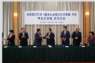
남북민화협 금강산 상봉행사 연대모임