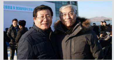
동서해선 남북철도 도로연결 및 현대화 착공식