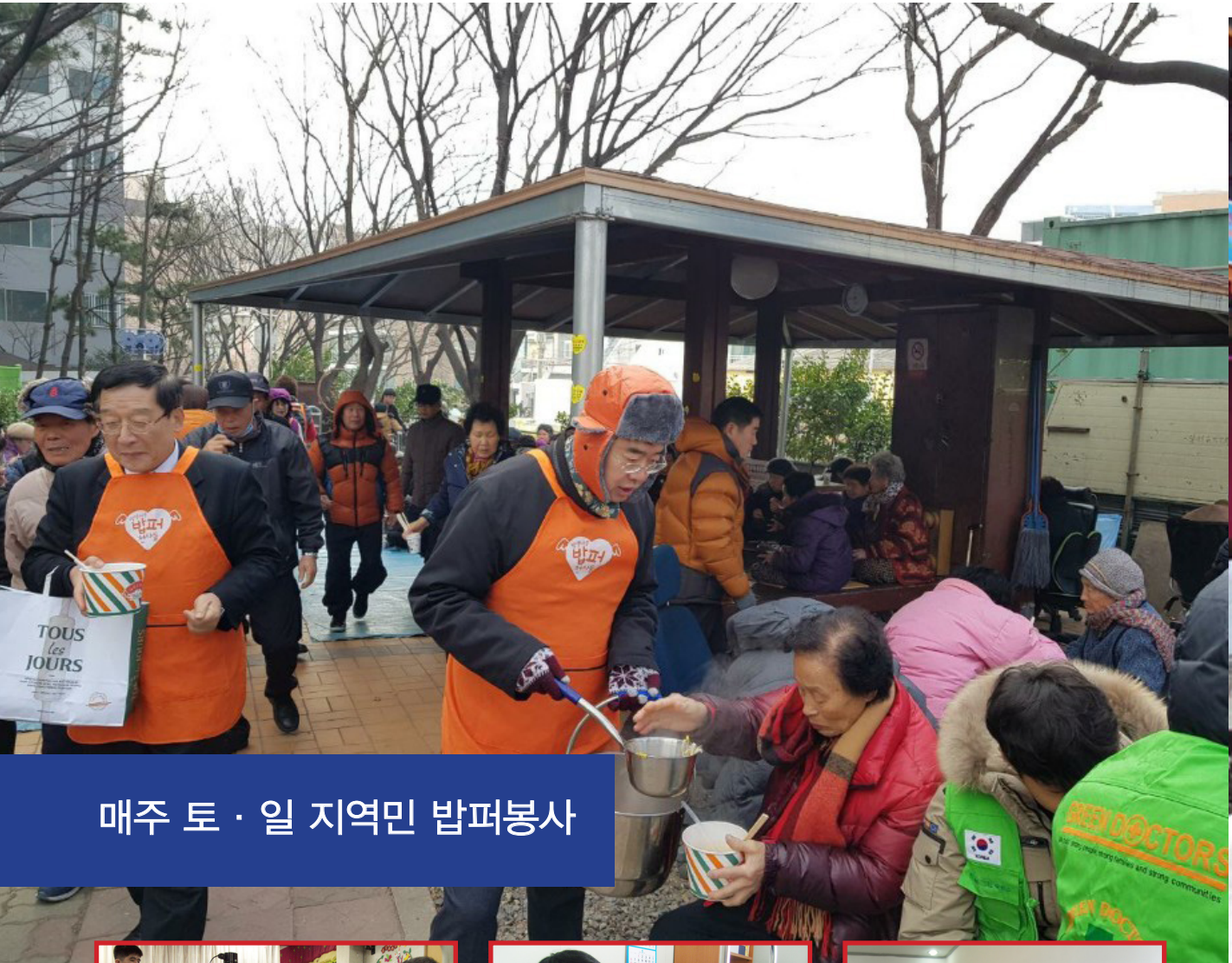
매주 토 · 일 지역민 밥퍼봉사

봉사의 시작 - 백양의료봉사단 설립, 19년 동안 의료봉사와 나눔을 실천 그린닥터스 재단설립(2004), 세계평화기여... 지진 쓰나미 북한개성병원