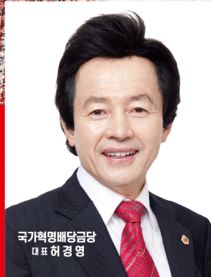
국가혁명배당금당 대표 허경영