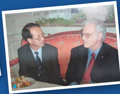
2002년 노벨 평화상 시상 축하 고위급 국제회의 참석 후 미국의 러플린 노벨물리학상 시상자와의 면담