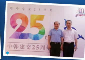
중국과학원 빅데이터 연구소장 (국무원 참사 차관급)과 함께