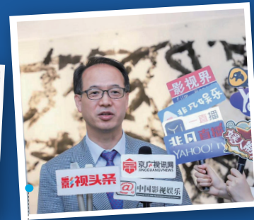
한중 간 문화, 체육, 예술 분야 협력 강화를 위해 중국 언론사들과 인터뷰하는 장면