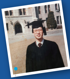
고려대학교 재학 시절