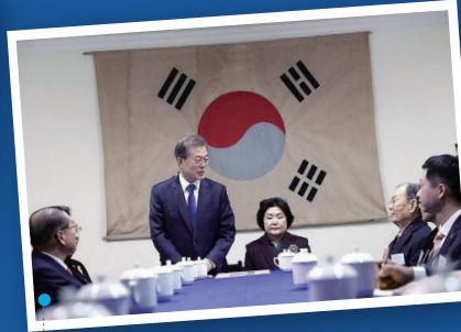
2017년 문재인 대통령 총칭 대한민국 임시정부청사 방문 시