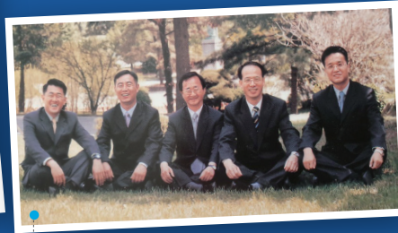
2004년 국방대학교 파견 시 국방전문가들과 함께