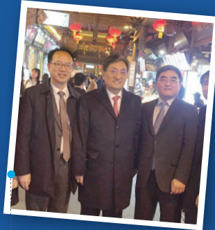
2017년 12월 문재인 대통령 총칭 대한민국임시정부 청사 방문 시 촬영된 당시 주중국대사와 함께