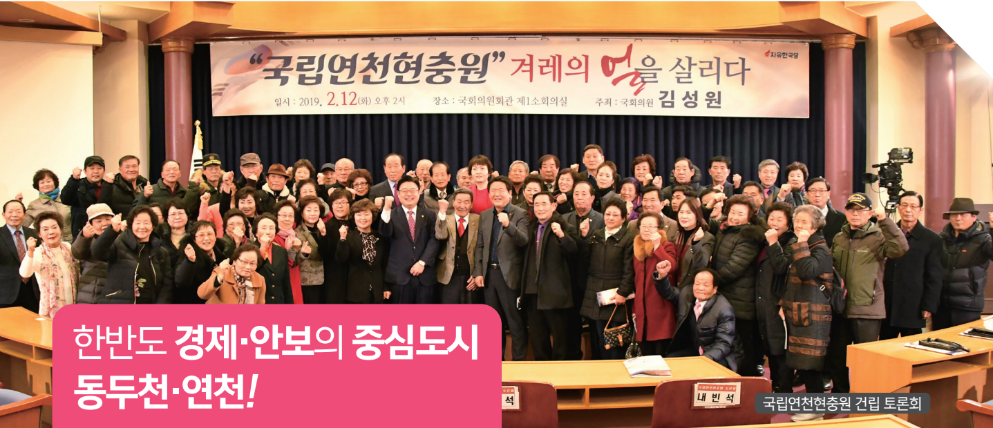
국립연천현충원 건립 토론회