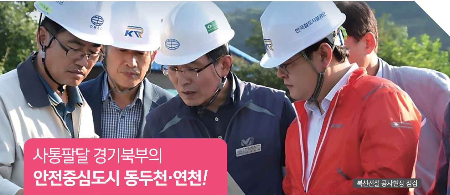
복선전철 공사현장 점검