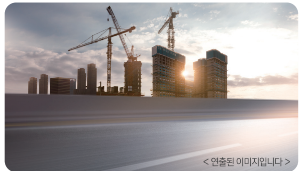
< 연출된 이미지입니다 >

경기북부 경제 활성화와 국립연천현충원 건립에 따른 교통 수요 확대에 대비해 서울과 동두천·연천을 잇는 남북고속도로 건설을 추진하겠습니다.