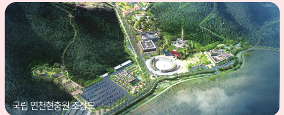
국립 연천현충원 조경도

국립 연천현충원이 총 10만기 규모로 진행되고 있습니다. 하루라도 빨리 국립 연천현충원 건립을 마무리하여, 연중무휴 많은 내방객들이 연천·동두천을 찾아 새로운 경제 활력을 불어넣을 수 있도록 하겠습니다.