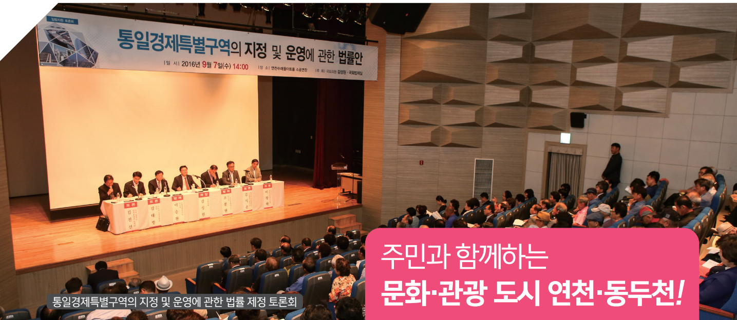
통일경제특별구역의 지정 및 운영에 관한 법률 제정 토론회