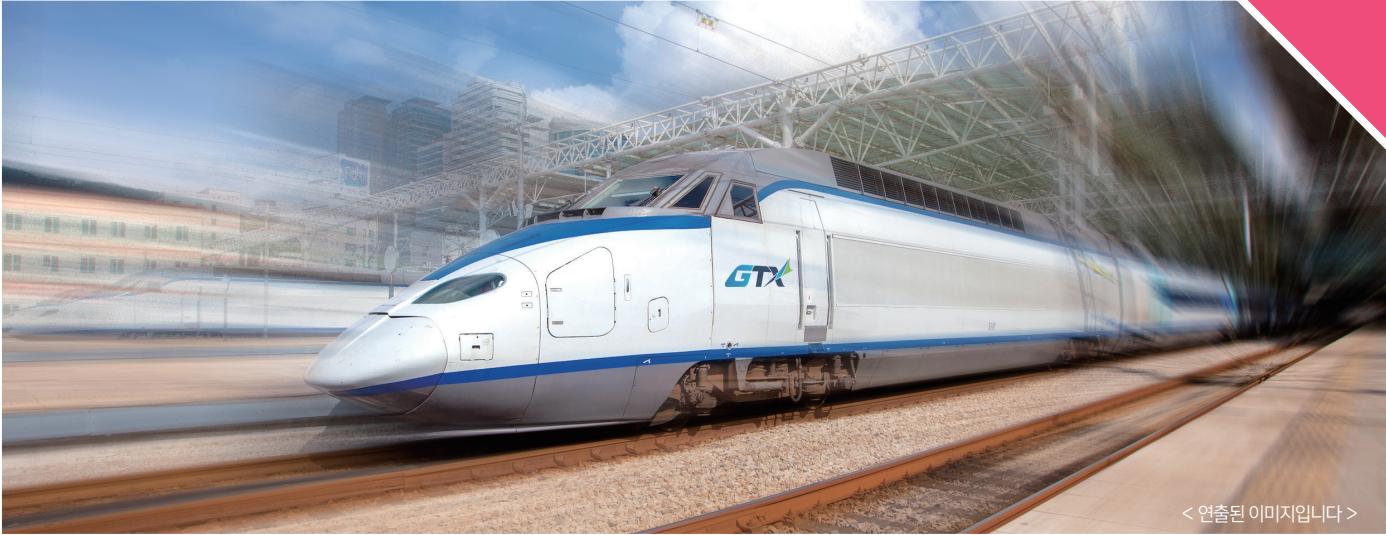
< 연출된 이미지입니다 >