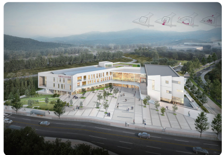
사진은 세종시 청소년수련관 조감도.