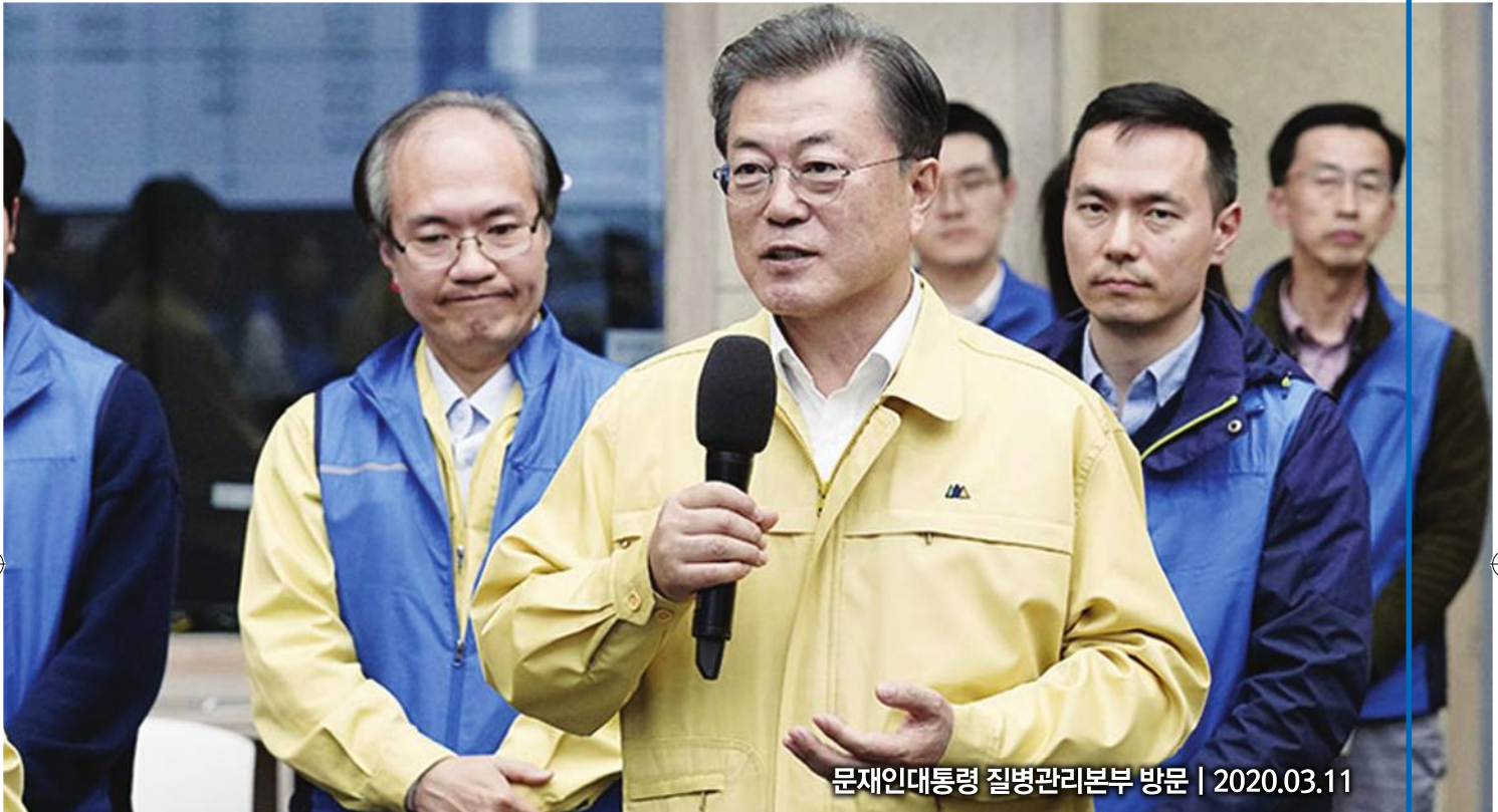
문재인대통령 질병관리본부 방문 | 2020.03.11

“고맙고 고맙다는 말씀을 드립니다” “일본이 열심히 해서 세계가 인정하는 좋은 성과를 냈습니다” “일본에 대한 칭찬과 격려는 국민 스스로에 대한 칭찬과 격려이기도 합니다”