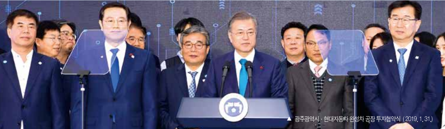
▲ 광주광역시 · 현대자동차 원성차 공장 투자협약식 (2019. 1. 31.)

‘ 광주형 일자리 ’를 성공시킨 주역 직접고용 1,000 여명, 간접고용 12,000 여명