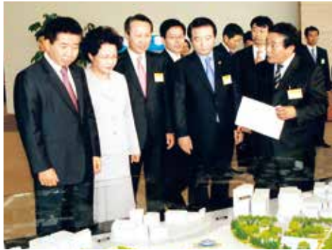
▲ 2007년 <아시아문화중심도시종합계획> 대국민보고