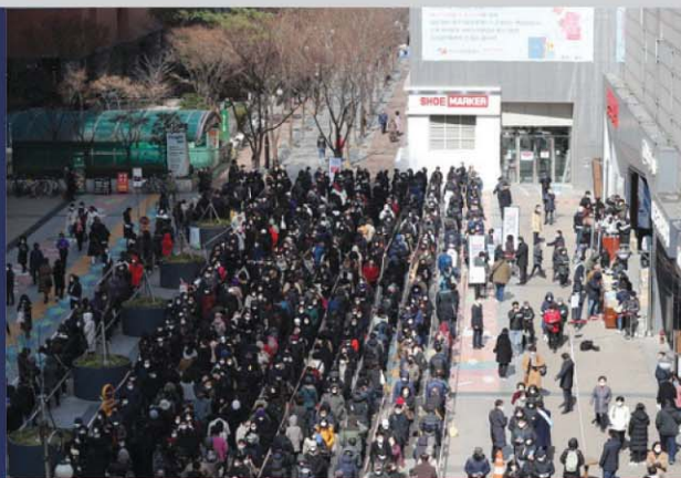
마스크를 사기 위해 줄을 서고 있는 국민들