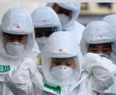
바이러스와 사투하고 있는 의료진

세계 최고 수준 ‘의료진의 헌신’ 세계 최고 수준 ‘국민 참여’로 코로나 19를 이겨내고 있습니다. 우리는 승리할 것입니다!