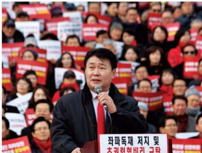
'19.1.27. 좌파독재 저지 및 초권력 비리 규탄대회