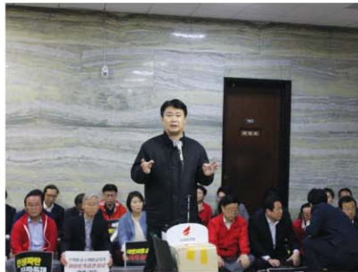
'19.4.26. 공수처법 · 선거법 저지 긴급 의원총회