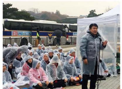
'19.11.24. 청와대 앞 비상의원총회

좌파독재에 저항했다고 현역 국회의원을 무더기로 기소하는 정권, 독재가 아니고 무엇이겠습니까? 국민과 함께 좌파독재 를 막기 위해 끝까지 싸우겠습니다!