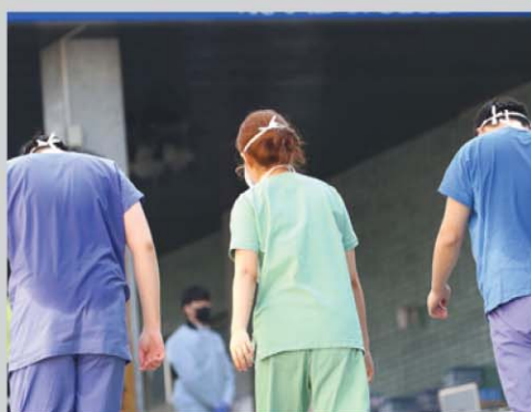
땀에 젖은 의료진의 뒷모습