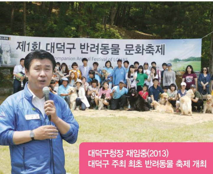
대덕구청장 재임중(2013) 대덕구 주최 최초 반려동물 축제 개최