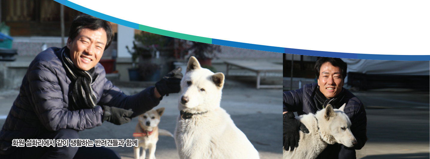
화원 설화리에서 같이 생활하는 반려견들과 함께