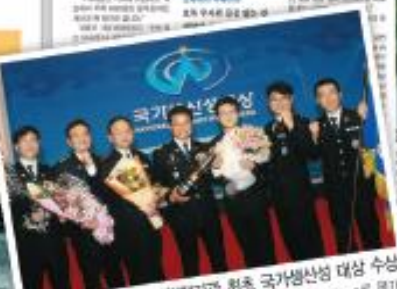
충북청장 재직시 중앙행정기관 최초 국가생산업 대상 수상 신상인·발상지 천원으로 아문 주폭 척결 성과를 World Class로 명기