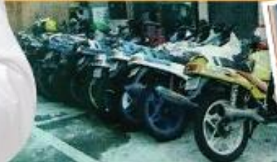
"속이 다 시원해요" 폭주족 검거관련 주민여론

조선일보 2012년 6월 9일 토요일 뉴스 초점 '주폭과의 전쟁' 사령관 김용판 서울경찰청장 임문일담