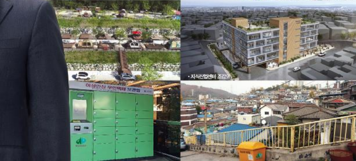
· 지식산업센터 조감도