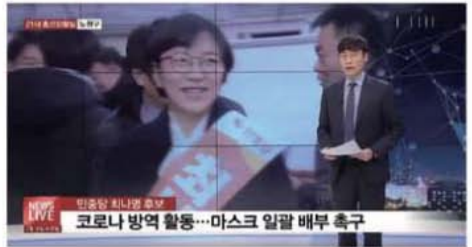
▲ 딜라이브 서울경기케이블TV 3월 18일 방송분

길에서 만난 80대 주민의 낡은 마스크를 보고, '정보력이 없는 주민도, 이동과 의사소통이 어려운 주민도, 돈이 없는 주민도 누구나 차별없이 바이러스로부터 보호받아야 한다.' 생각했습니다.