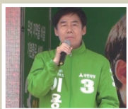
국민의당 후보시절 “친노 운동권 좌파들이 정신차리게” (‘16년 4월 선거유세)

호남지역에서 다른 당 또는 무소속으로 출마해 당선된 후 우리 당으로 입당 또는 복당하겠다고 선거 운동을 하는 사례들이 있는데 이 경우에도 우리 당은 입당, 혹은 복당을 불허할 것이다. <더불어민주당 고위전략회의 브리핑 2020. 3. 16>