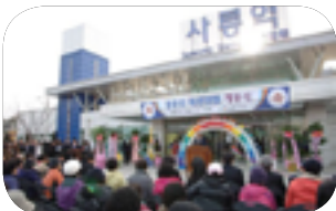
경춘선 복선전철 개통식