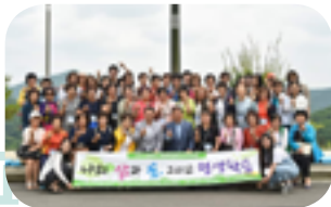
평생을 책임지는 교육도시로의 발돋움