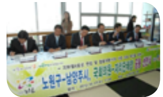
지하철 4호선 시대 본격화 (공동선연식)