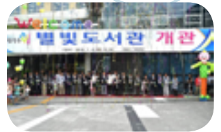
남양주시 전역에 도서관 14개 개관 성과