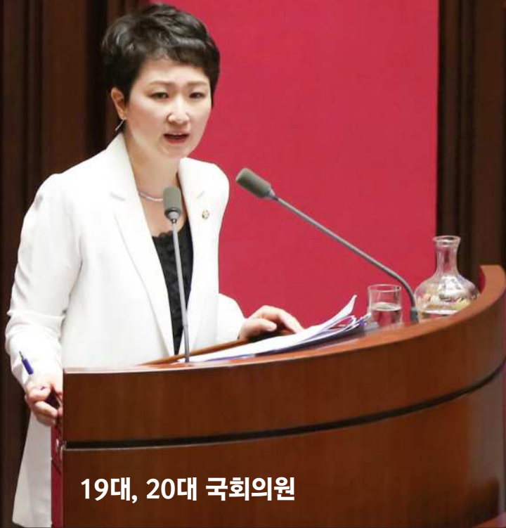
19대, 20대 국회의원

“청년이 원하는 양질의 일자리는 혁신성장과 산업구조조정을 통해 나옵니다. 그런데 문재인 정부는 소득주도성장 정책, 무분별한 공무원 증원 등 경제를 경직시켜 혁신을 저해하는 방향으로 가고 있습니다.”