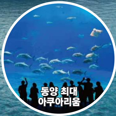
동양 최대 아쿠아리움