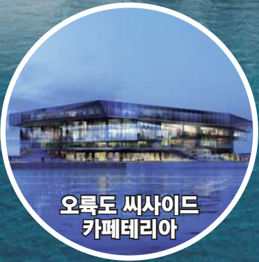
오륙도 씨사이드 카페테리아

저의 목표는 연간 1,000만 명의 관광객이 방문하고, 이들이 일 인당 평균 10만원의 돈을 쓰고 가게 만드는 것입니다. 그리고 이 돈이 우리 주민들의 소득증대로 이어지게 만드는 것입니다. 이 곳의 생산유발효과는 매년 1조원이 넘을 것입니다.