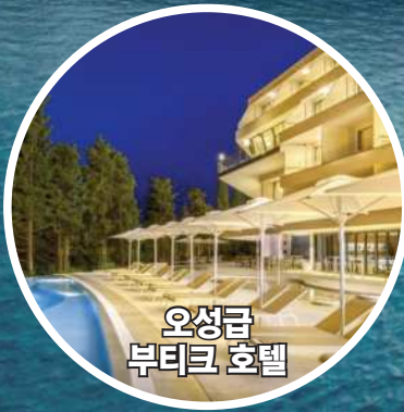
오성급 부티크 호텔