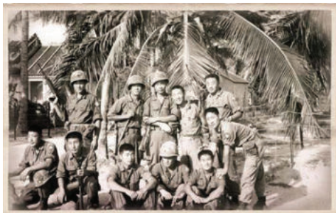
▲ 월남전 참전 당시 전우들과.

40대 이상에서 장기표를 모르는 사람은 별로 없다. 그러나 흔히 '친북좌파'가 아닐까 하고 의심하는 사람이 많지만, 장기표