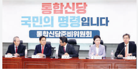
▲ 미래통합당 창당을 위한 통합신당준비 회의