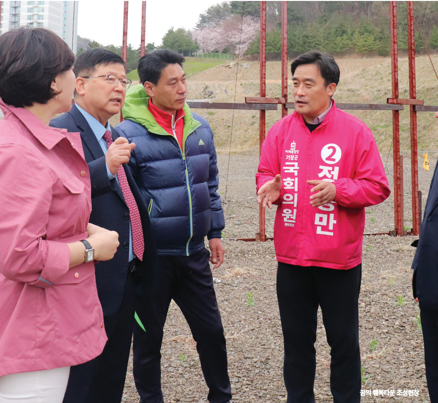
꿈의 행복타운 조성현장