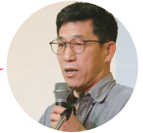
진중권 전 동양대 교수