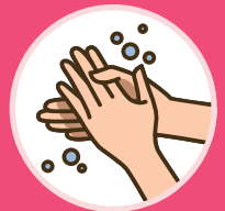
물과 비누로 자주 손씻기