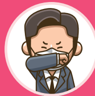
기침할 때 입과 코 가리기