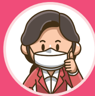
마스크 반드시 착용