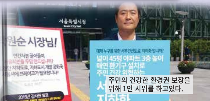
주민의 건강한 환경권 보장을 위해 1인 시위를 하고있다.