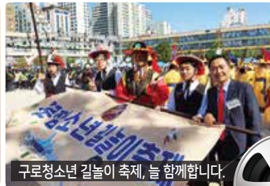
구로청소년 길놀이 축제, 늘 함께합니다.