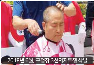
2018년 6월, 구청장 3선저지투쟁 삭발

서부간선지하도로 환기구 설치반대를 위해 1인시위와 공사현장 방문, 각동네별 행사와 봉사활동에 참여하며 구로주민과 함께 깊은 정을 나누었습니다. 10년 넘게 저를 지켜본 많은 분들의 기대에 어긋나지 않게 꼭 입성하겠습니다. 구로기적을 이루고 싶습니다.