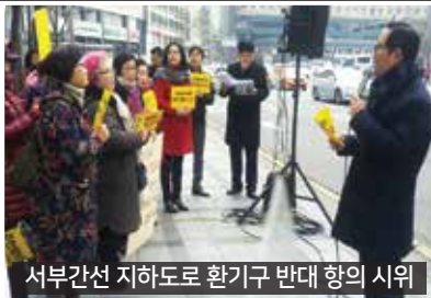
서부간선 지하도로 환기구 반대 항의 시위