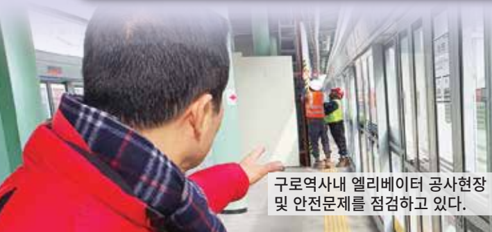
구로역사내 엘리베이터 공사현장 및 안전문제를 점검하고 있다.