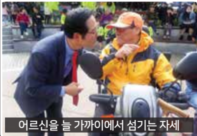
어르신을 늘 가까이에서 섬기는 자세