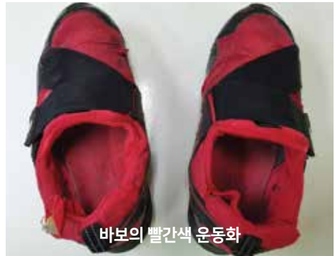
바보의 빨간색 운동화

저는 구로에서 20년 째 살면서 구로 때문에 웃고 울었습니다. 세번 선거에서 떨어지는 아픔도 있었지만 제가 희생하면서 구로발전에 도움이 되는 일이라면 헌신해왔습니다. 간절히 일하고 싶습니다. 더 이상 저를 울리지 말아주십시오. 피눈물로 호소합니다. 감사합니다.