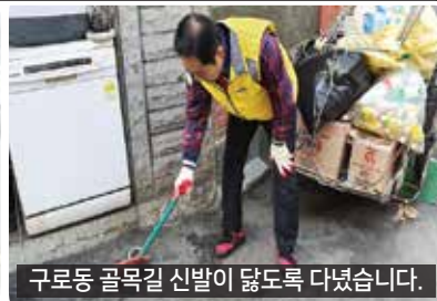
구로동 골목길 신발이 닳도록 다녔습니다.