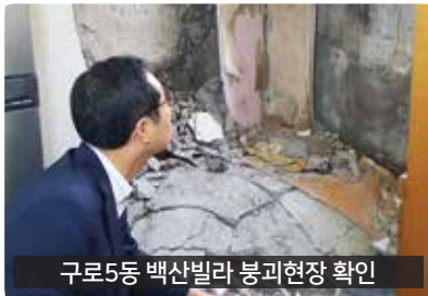
구로5동 백산빌라 붕괴현장 확인