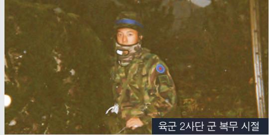
육군 2사단 군 복무 시절

서울시 광진구 천호대로 628 청화빌딩 5층 M. 010-7581-0415 facebook.com/gowith24