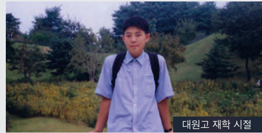
대원고 재학 시절

강원도 양구의 칼바람을 아직도 기억합니다. 지금 이 순간에도 조국과 국민을 위해 헌신하고 있는 국군장병 여러분께 깊이 감사드립니다. 여러분의 땀과 노력이 헛되지 않도록 저 또한 묵묵히 광진과 대한민국의 발전을 위해 최선을 다하겠습니다. 건강하게 남은 군 복무 마치시길 기원합니다.