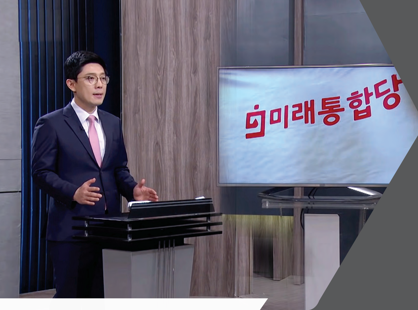
미래통합당 정강정책 연설 (2020.2.19 KBS 방영)