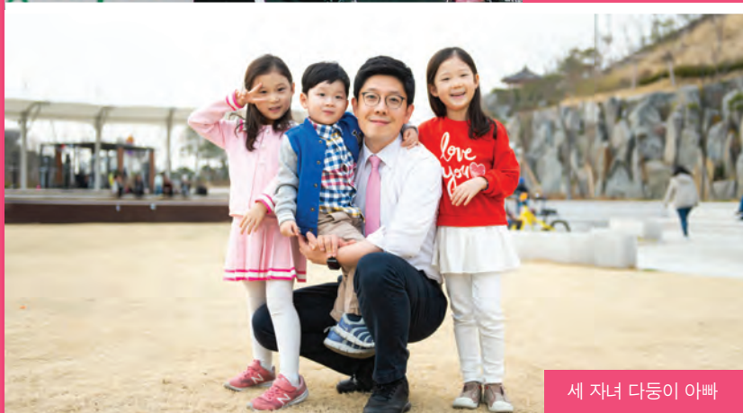
세 자녀 다동이 아빠