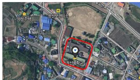
청양군 지역거점 노인통합복지센터 건립 위치도