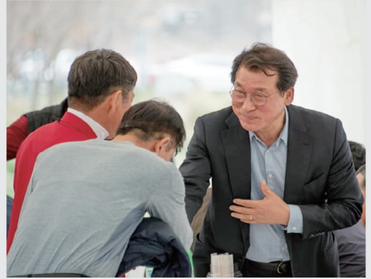
각계각층과의 간담회를 통해 소통하는 등 항상 지역민의 애로 및 불편사항을 해결하겠습니다.