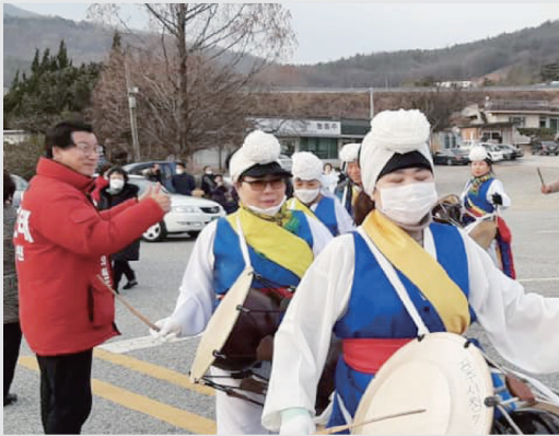
가칭 『내 고장 발전위원회』를 설립·운영하여 현장의 목소리를 경청하고 공동체 구현에 앞장 서겠습니다.