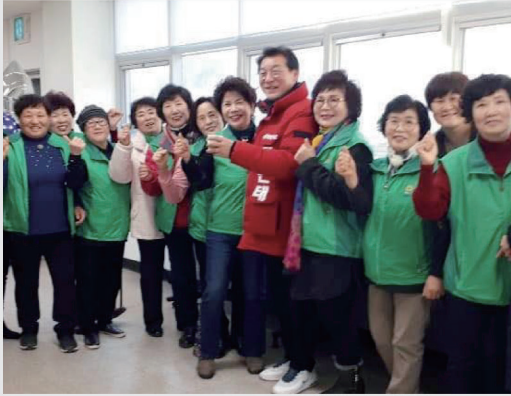
민원상담 센터를 운영하여 적극적으로 주민과 소통하고 애로 사항을 해결하겠습니다.