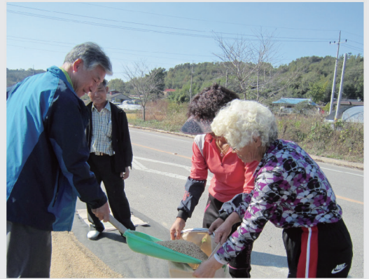
지방 자치 단체와 유기적인 대화와 협력을 강화하여 지역 발전을 위한 대안을 찾아내겠습니다.