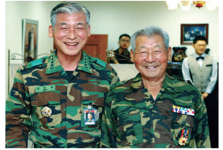
6.25 참전용사(해병대) 부친과 함께