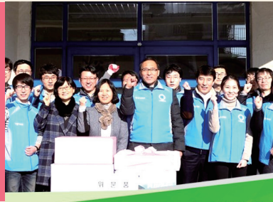
[뉴스N온에어] 홍윤식 행정자치부 장관, '제 당당이 형광등 교체, 도배도 직접 했었죠'