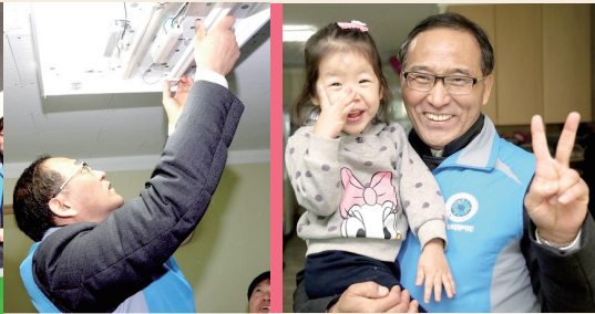
7월 23일, 행정자치부 홍윤식 장관 을 비롯한 행정자치부 임직원들이 봉사활동을 위해 서울SOS어린이마 음을 방문했습니다.