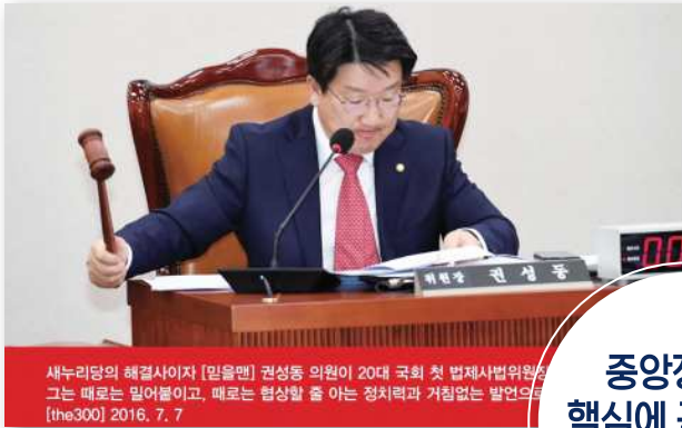
새누리당의 해결사이자 [믿음맨] 권성동 의원이 20대 국회 첫 법제사법위원회 그는 때로는 밀어붙이고, 때로는 협상할 줄 아는 정치력과 거침없는 발언으로 [the300] 2016. 7. 7