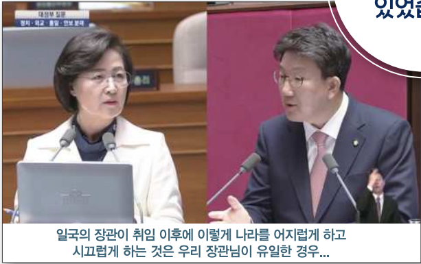
일국의 장관이 취임 이후에 이렇게 나라를 어지럽게 하고 시끄럽게 하는 것은 우리 장관님이 유일한 경우...