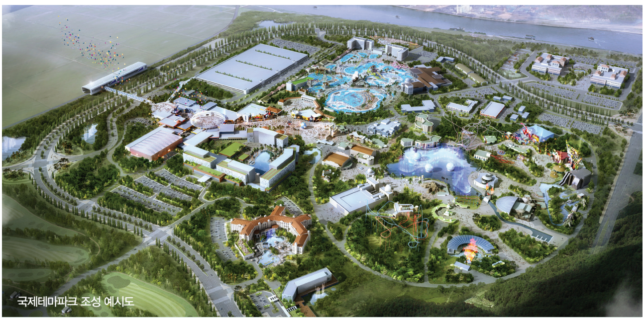
국제테마파크 조성 예시도