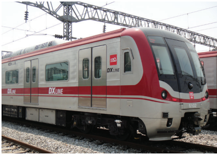
신분당선 복선전철 연장