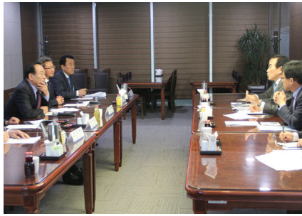
KTX환승역(매송 어천역) 설치 관계기관 협의