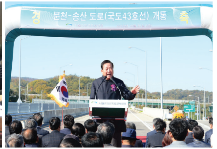
분천~송산 국도대체우회도로 개통