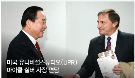
미국 유니버설스튜디오(UPR) 마이클 실버 사장 면담