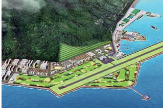
▲울릉공항 건설 조감도