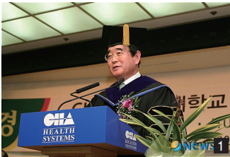
1 차의과학대학교 총장 취임식