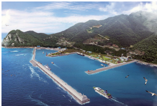
▲울릉(사동)항 2단계 개발 조감도