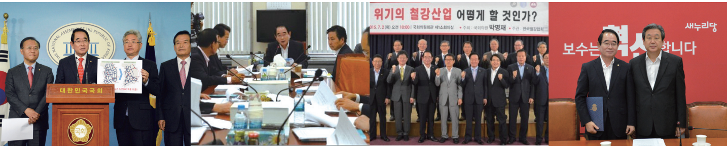
▲ 대구·경북 국회 예결특위 의원들 기자회견