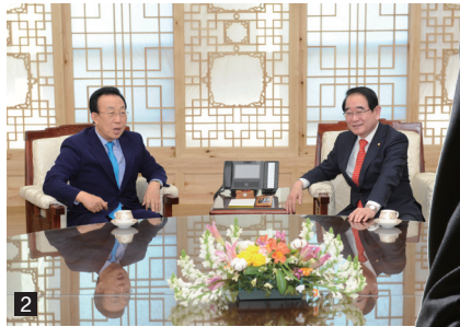
2 김관용 경북지사와 도정발전 환담 3 행정자치부장관 취임식