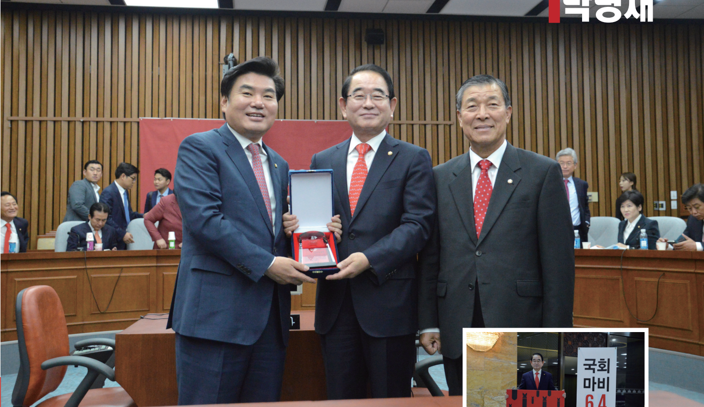
▲ 새누리당 국감우수의원 2014·2015년 2년 연속 선정 모습