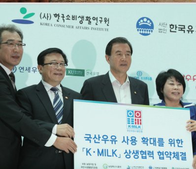
이동필 농림축산식품부 장관 참석 국산우유 사용 상생협력 협약체결식