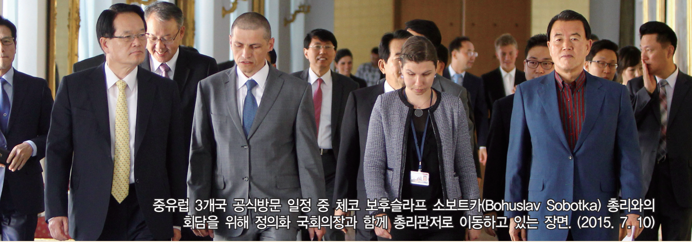
중유럽 3개국 공식방문 일정 중 체코 보후슬라프 소보트카(Bohuslav Sobotka) 총리와 의 회담을 위해 정의화 국회의장과 함께 총리관저로 이동하고 있는 장면. (2015. 7. 10)