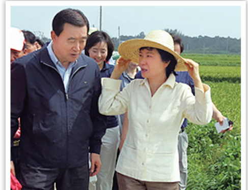
2012. 9. 13 논산 태풍피해 농가 방문

지역주민 여러분들이 주신 믿음을 바탕으로 모든 열정과 능력을 쏟아 더욱 힘 있고 큰 예산·홍성의 일꾼으로 거듭나겠습니다.