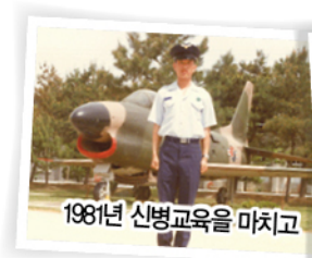
1981년 신병교육을 마치고