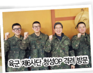
육군 제6사단 청성OP 격려방문

“국토방위와 치안을 위해 불철주야 고생하시는 국군장병과 경찰 여러분의 노고에 깊이 감사드립니다. 나라를 위해 헌신하는 분들이 보람을 느낄 수 있는 대한민국을 만들기 위해 최선의 노력을 다하겠습니다.”