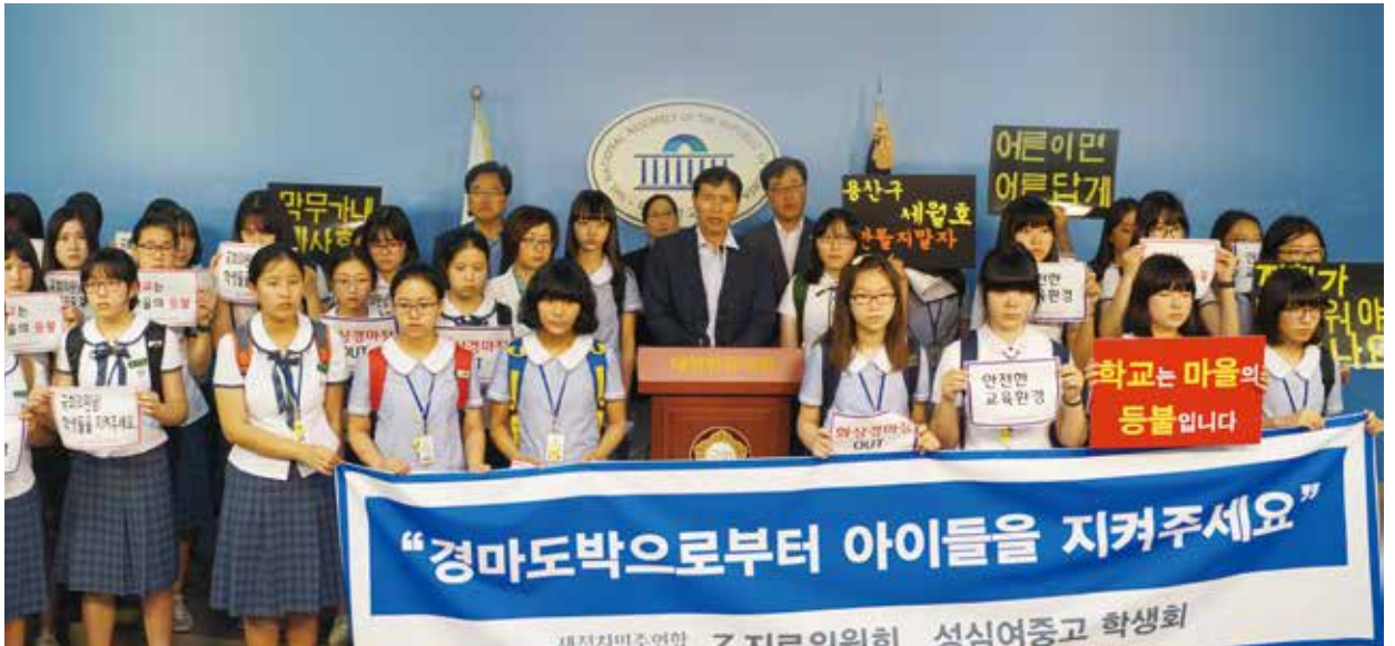
※ 학교 앞 화상경마장 개장을 막아달라는 여고생들과 함께한 기자회견

불의와 타협하지 않고 권력 앞에 물러서지 않겠습니다. 아이들의 꿈, 청년들의 도전, 어머니와 아버지의 행복, 어르신들의 편안한 노후를 반드시 지켜내겠습니다.