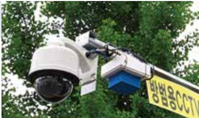
[노후 CCTV 개보수]