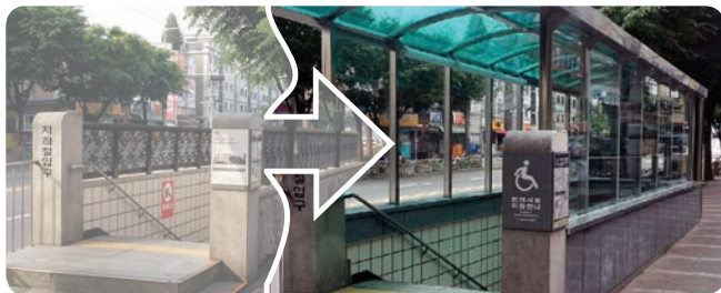
▲ 남구로역 6번 출구 캐노피 설치