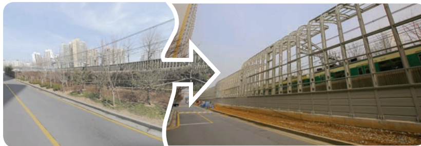
▲ 구로5동 철길변 방음벽 설치