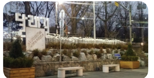
▲ 문성골 보행자 우선도로 <달래길> 조성