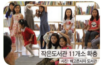
작은도서관 11개소 확충