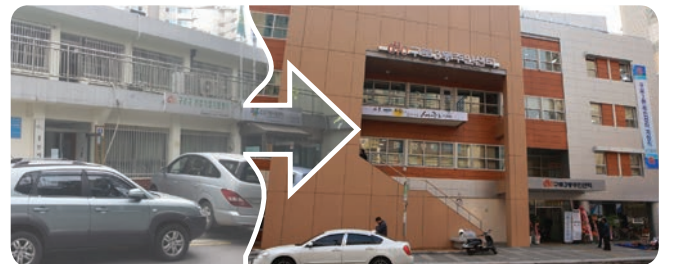
▲ 구로3동 주민센터 신축