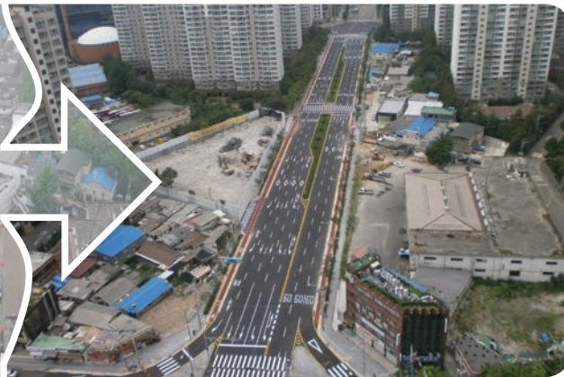
▲ 신도림 십자도로, 35년 만에 개통!