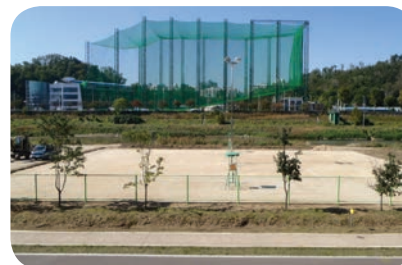
▲ 안양천 족구장