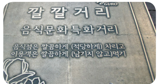
▲ 디지털단지 짹짹거리 정비