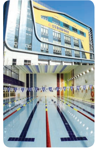
▲ 신도림 생활 체육센터