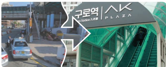
▲ 구로역 에스컬레이터 설치