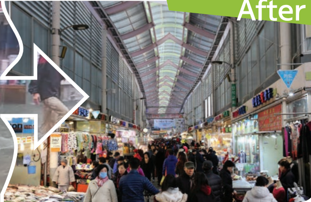
▲ 남구로시장 현대화/ 이제는 물난리 끝~