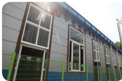
▲ 구로5동 게이트볼장