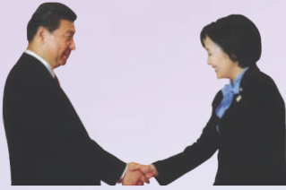
2014.7.3. 시진핑 중국 주석과의 만남