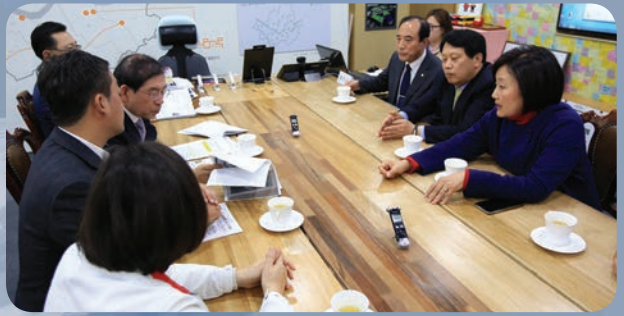
▲ 구로공구상가 리모델링 계획 박원순 서울시장 면담 구로기계공구상가 조합 임원진과 함께 (2016.3.22)