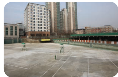
▲ 신도림 테니스장