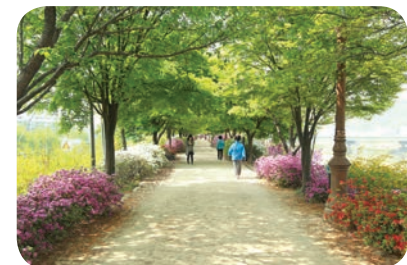
▲ 구로 올레길 조성