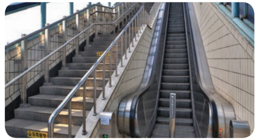
▲ 구일역 에스컬레이터 설치