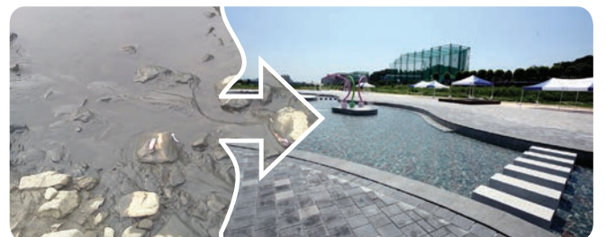
▲ 안양천의 즐거운 변화! 물놀이장 개장