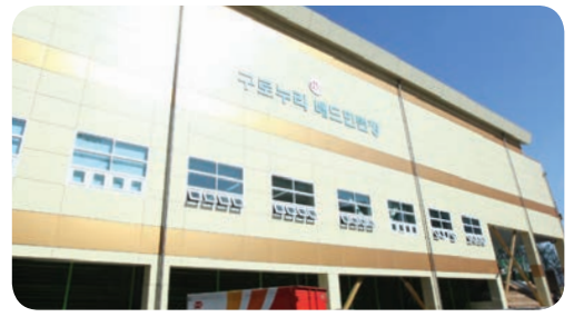
▲ 구로5동 배드민턴장