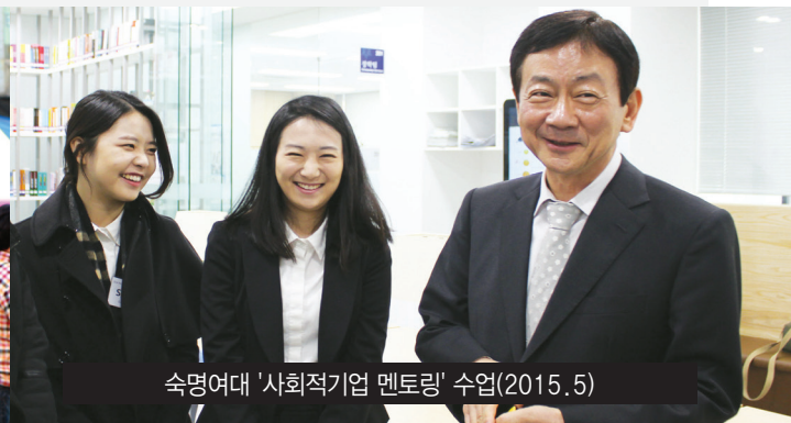
숙명여대 '사회적기업 멘토링' 수업(2015. 5)