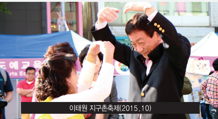
이태원 지구촌축제(2015. 10)