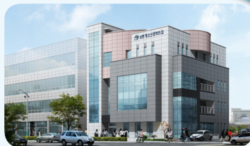
〈 남동 청소년 문화의 집 조감도 〉