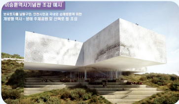
〈 이승훈 역사기념관 조감도 〉