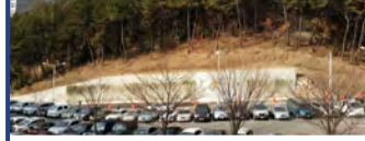
22.동래문화회관 일원 위험사면 정비사업