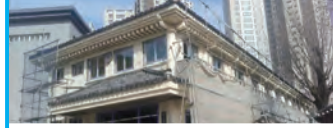
26. 동래향교 유림회관 리모델링