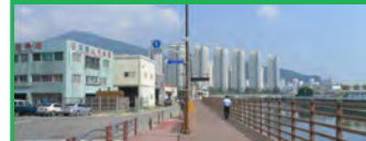
33. 온천천-수영강 산책로 설치공사