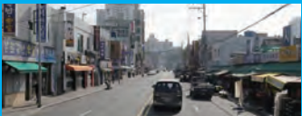
31. 안락동 서원시장 일원 보도 설치