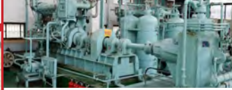
28.명륜배수펌프장노후펌프교체 및 특고압수전판케노피 설치