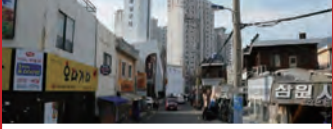
20. 명륜제일교회 일원 도로확장