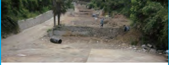
24. 동래사적공원 무허가건축물 정비