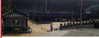
25. 동래문화회관 공영주차장 확장공사