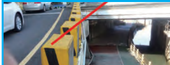
32. 동래원동교 가각 정비