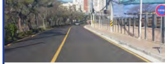
29. 중앙여고 ~ 동래중 도로 확장 공사