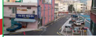
27. 동래우체국 주변 도로개설공사