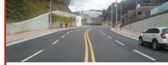
23. 동래문화회관 일원 도로확장 공사