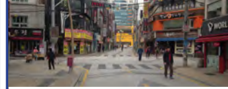
30. 동래 고도심 재창조 동래방래사업