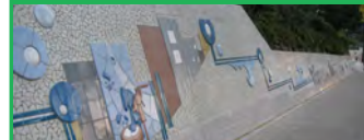
44. 명장정수장 경계담장 정비