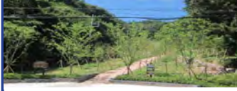
21. 동래사적공원 무허가철거지 복원공사