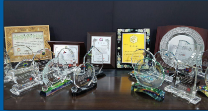
모두 성남시민 수정구민이 주신 상입니다. (22개)