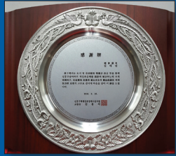
신흥주공재건축정비조합 (감사패) 약 100억원 주민 부담 경감