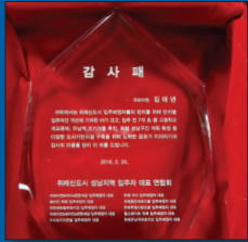
위례신도시 입주자 대표 (감사패) 위례 조성 시부터 전폭적 지원