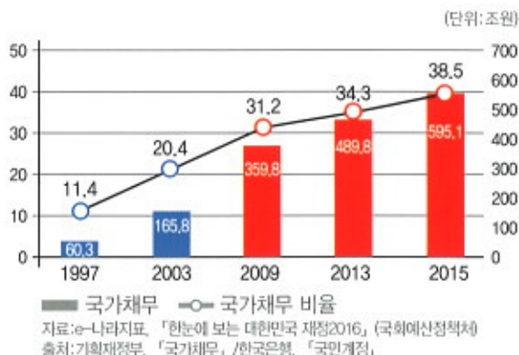
국가채무 ○ 국가채무 비율 자료: e-나라지표, 「현안에 보는 대한민국 재정2016」(국회예산정책처) 출처: 기획재정부, 「국가채무」/한국은행, 「국민계정」