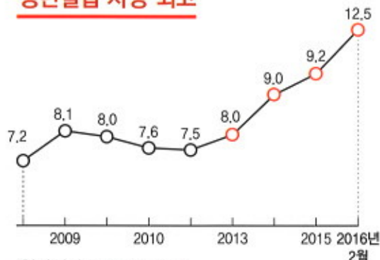
청년실업률 *청년: 15~29살 (단위:%)