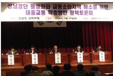
성남공단 활성화와 교통소외지역 해소를 위한 대중교통 확충방안 정책토론회 개최(2008) → 상대원공단 활성화 사업 예산 확보