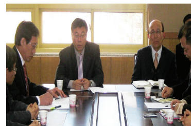
도촌초등학교 어린이 통학로 안전문제 해결을 위한 간담회 개최(2011) → 해결