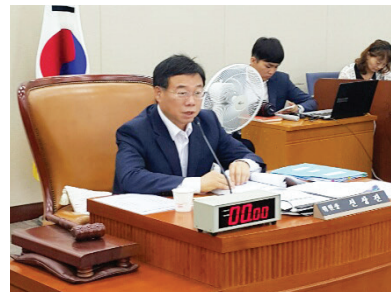
국회 메르스대책특위 위원장으로 활약