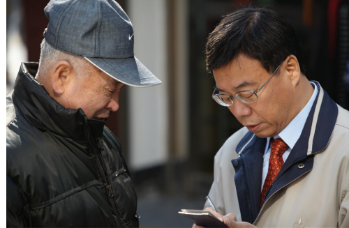
동네 골목에서 만난 어르신의 어려움을 청취하는 신상진 의원