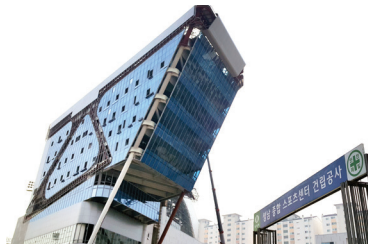
신상진 의원이 유치한 「성남종합스포츠허브센터」 공사현장(2016년 말 완공예정)