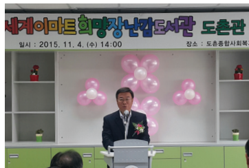
도촌동 종합사회복지관에 장난감 도서관 유치