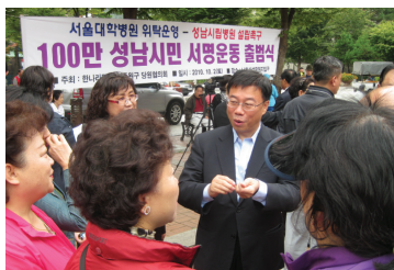
성남시립병원의 서울대병원 위탁운영 촉구를 위한 100만 성남시민 서명운동 개최(2010)