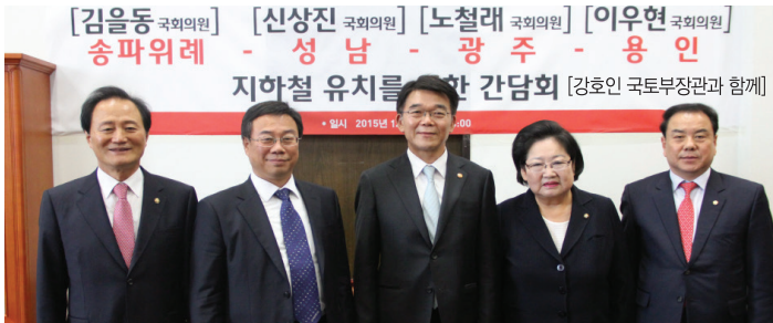
「위례-성남-광주-용인선」 지하철 역사 유치를 위해 국토부 장관과의 간담회