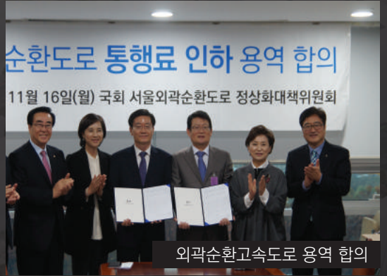
외곽순환고속도로 용역 합의

노원구민 비롯해 212만 명의 인하 요구로 국토부 연구용역 착수, 최대 30~40% 통행료 인하 가능