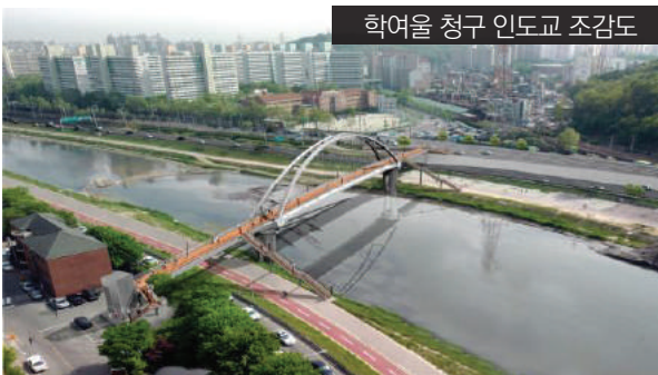
학여울 청구 인도교 조감도