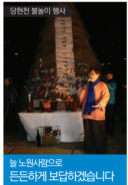
당현천 불놀이 행사