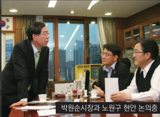
박원순시장과 노원구 현안 논의중