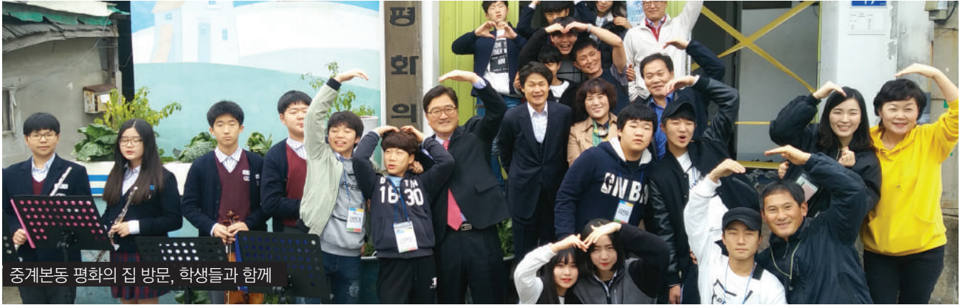
중계본동 평화의 집 방문, 학생들과 함께