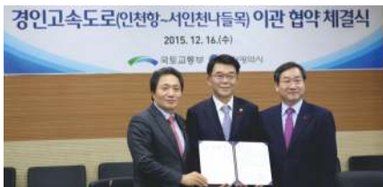
경인고속도로(인천항-서인천나들목) 이관 협약 체결식 2015. 12. 16.(수) 국토교통부 인천광역시