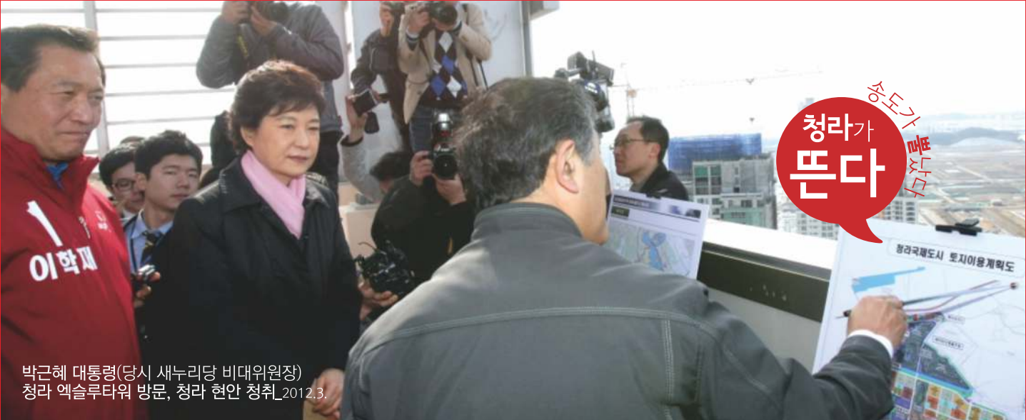
박근혜 대통령(당시 새누리당 비대위원장) 청라 엑셀루타워 방문, 청라 현안 청취_2012.3.