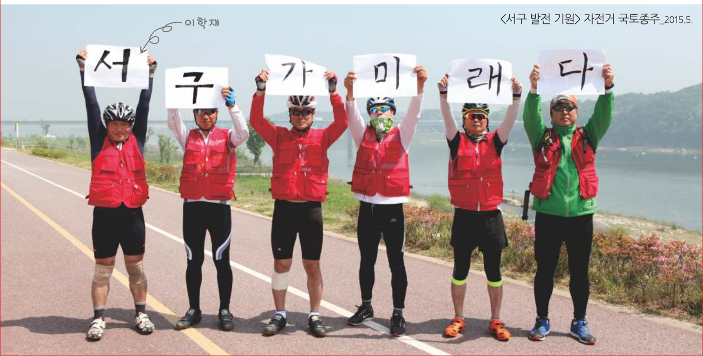
<서구 발전 기원> 자전거 국토종주_2015.5.

서구의 꿈을 서구 주민과 함께, 3선 국회의원의 힘으로 반드시 해내겠습니다.