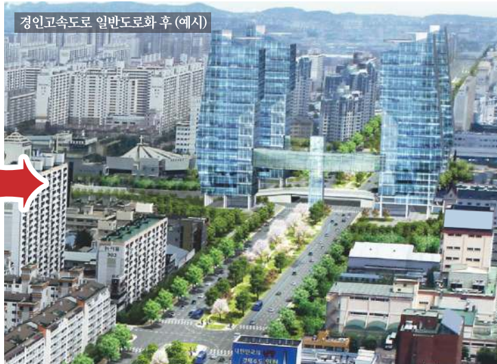
경인고속도로 일반도로화 후 (예시)