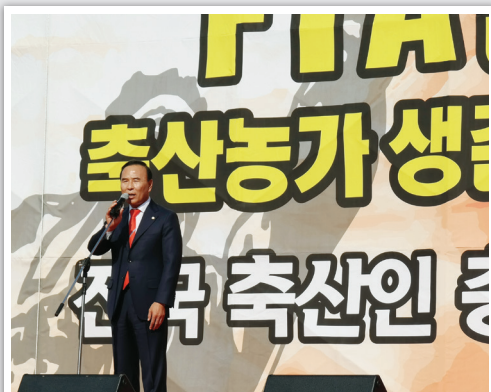
▲ FTA반대 전국 축산인 총결기대회 참석