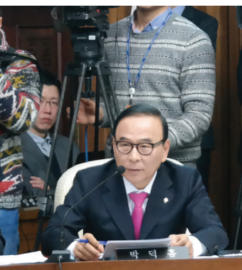
▲ 국무총리 후보자 인사청문회

건축 신공법 개발과 건설정책 개선에 앞장서며, 대한전문건설협회 중앙회 회장으로 활동했습니다. 경영하던 회사에서는 산업부분 최고 영예인 금탑산업훈장을 수상했고, 대한민국 사회공헌인물대상을 수상하는 등 각 분야에서 그 능력을 인정받았습니다.