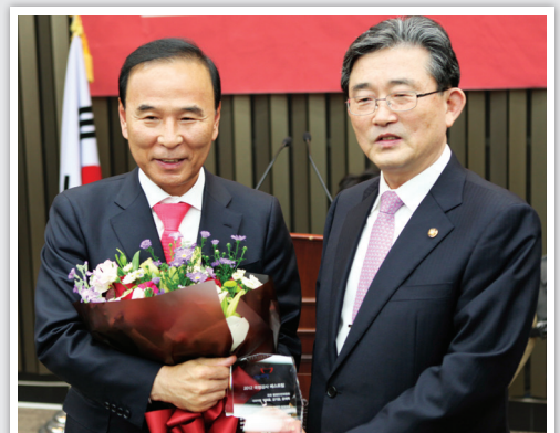
▲ 새누리당 국정감사 우수의원 수상