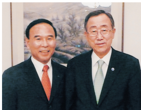
▲ 반기문 유엔사무총장과 함께