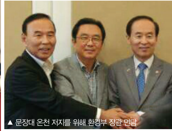
▲ 문장대 온천 저지를 위해 환경부 장관 면담

◀ 대정부질문에서 대청호 규제의 중복성을 지적하고 긍정적인 답변을 끌어냄