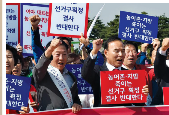
▲ 농어촌 선거구 사수를 위한 대규모 진회 주최