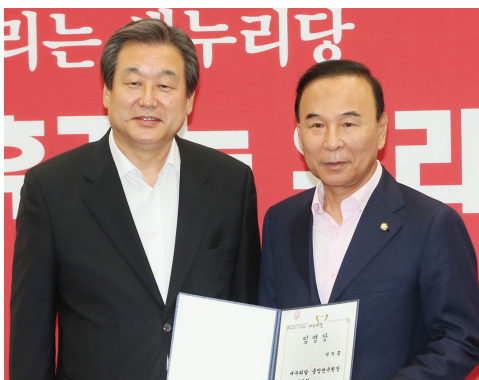
▲ 새누리당 중앙연수원장 임명