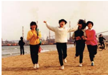
▶포항여고 시절 송도바닷가