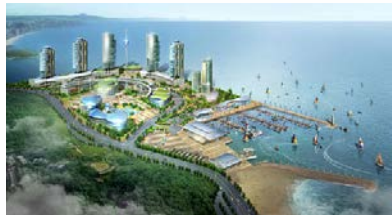
▶두호 마리나항 조감도