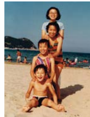
▶동지여중 시절 영일대해수욕장