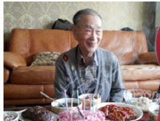
▶생전 아버지와 함께