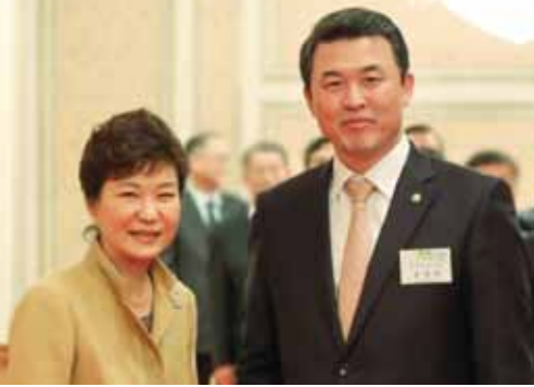
국회 국민평가 및 제20대 국회 희망 토론 제19대 국회의원 의정대상 1. 7.(목) 장소: 국회의원회관 제1소회의실 주관: 대한민국 국회의원