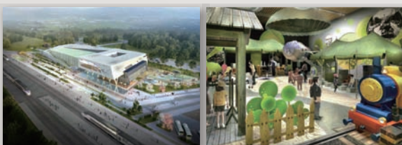
국립철도박물관 조감도 | 어린이 철도테마파크 연출사례