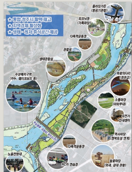
미호천 항공·수상레저 복합공원 계획도

어린이직업체험관·국립청주해양과학관(주중동 밀레니엄타운 부지), 어린이미술관·어린이영어도서관(구 연초제조창), 국립철도박물관(오송역)