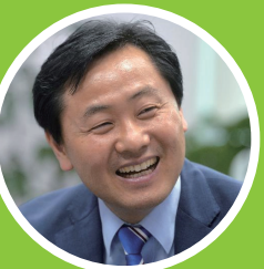
▲김관영 現 국회의원 [군산] 국민의당 전북도당위원장