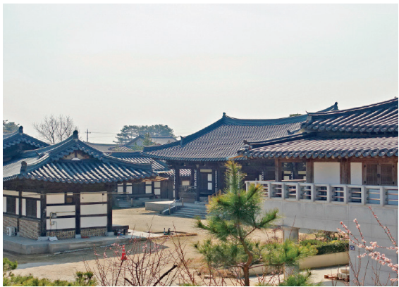
▲ 한국 인문학의 성지, 학성강당