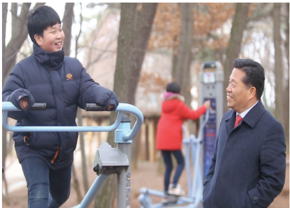
▲ 공정한 사회의 토대는 결국 사람입니다