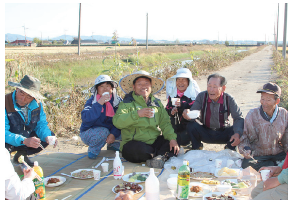
어르신들이 웃을 수 있는 고향으로 ▲