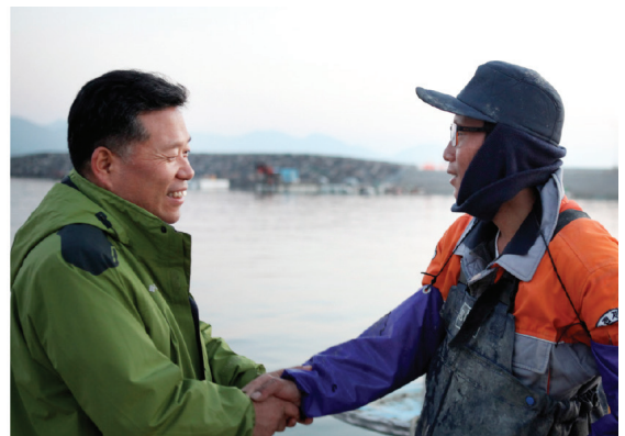
모두 함께 잘 사는 사회로 ▲