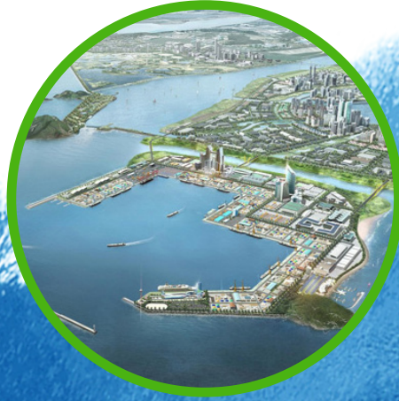
새만금 신항만 ▼