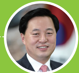
▲김두관 前 행정자치부 장관 前 경남도지사