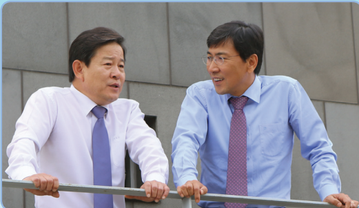
안희정 충남도지사 선대본부장 “다음 프로젝트도 네가 책임져!”