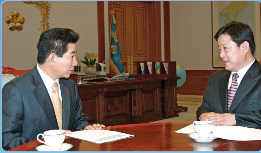
노무현대통령 청와대 사회조정비서관 “이번에도 기대가 됩니다, 정재호 비서관”

선거관리위원회 홈페이지에 가시면 가까운 사전투표소를 확인할 수 있습니다.